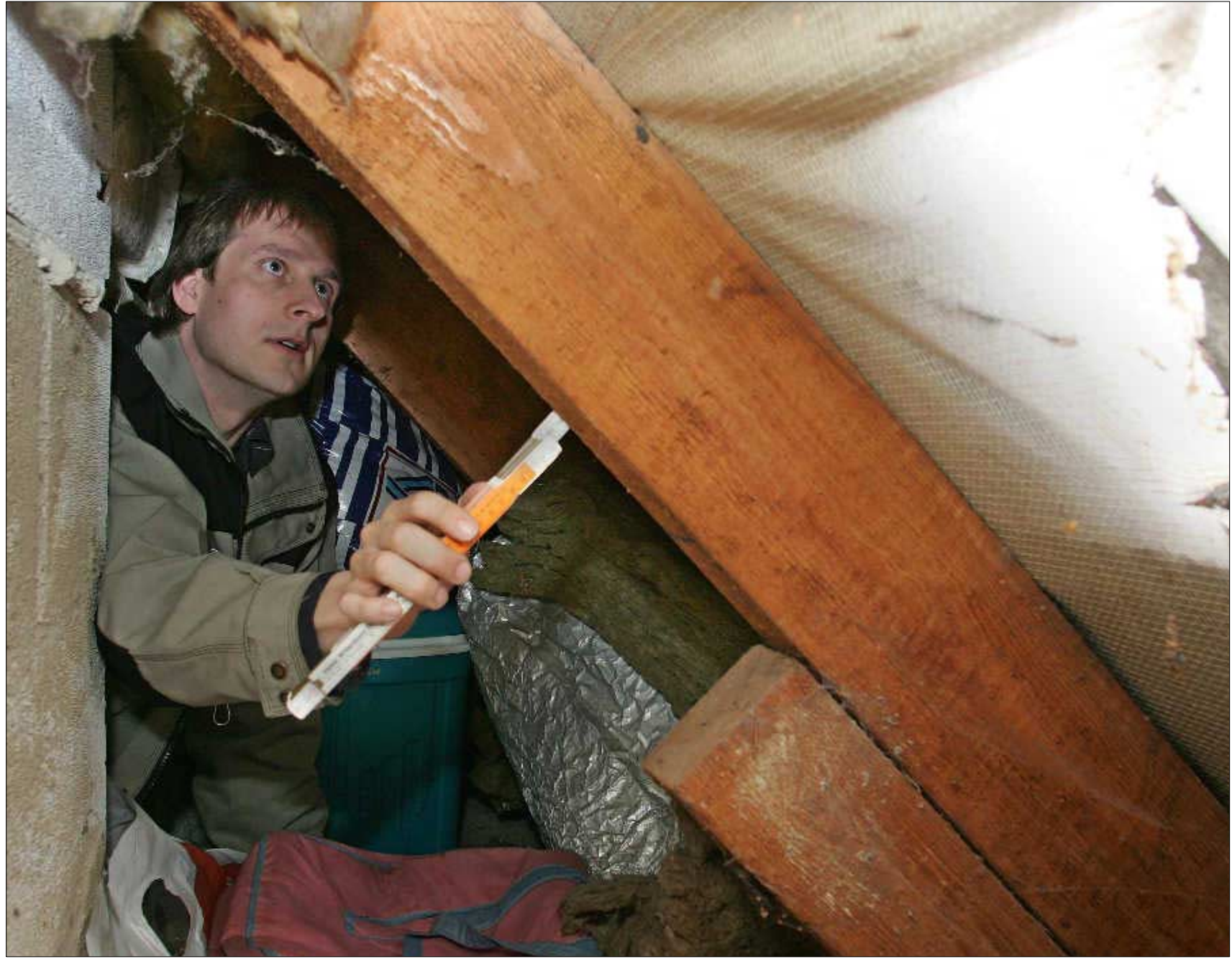
Blick in die Abseite: Das darunter liegende Zimmer ist meist nicht vor Wärmeverlust in diesem Randbereich geschützt. Hartens Rat: „einfach Mineralwolle oder Styropor auslegen – das geht leicht und ist billig“. Aber die unter den Dachpfannen gespannte Folie muss vorhanden und dicht sein – sonst wird jede Dämmung feucht.