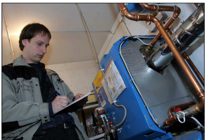
Fünf Jahre alt ist die Heizung – davon haben die Besitzer noch zehn Jahre lang gut. Wie sieht die Regelungstechnik der Heizanlage aus? Gibt es Außentemperaturfühler? Nachtabsenkung? Thermostatventile an allen Heizkörpern? Durch eine optimale Dämmung lässt sich der Energie-, hier Heizöl-Verbrauch um etwa 50 Prozent senken. Moderne Häuser verbrauchen zwischen 70 und 100 Kilowattstunden pro Quadratmeter Wohnfläche pro Jahr, ältere oft weit über 200 kWh/qm a, Energiesparhäuser unter 60.