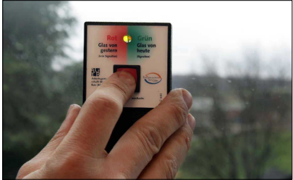
Das Glasmessgerät zeigt den Wärmedurchgangswert eines Fensters an. 1.4 haben neue Isolierglas-Fenster mit einer metallbedämpften Scheibe, 2.9 ältere, gleich aussehende.