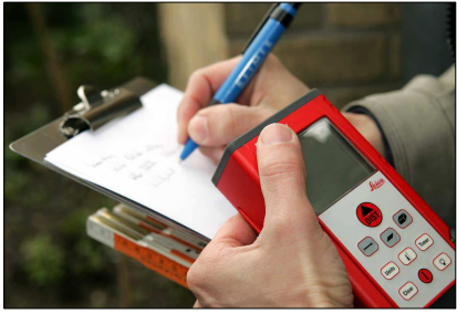
Das rote Lasermessgerät zur Aufnahme von Raummaßen.